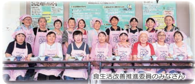
食生活改善推進委員のみなさん