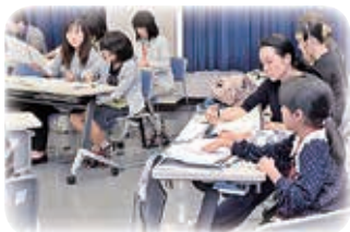
△今回のオペラの楽譜は何と156ページもあるんです！枚数の多さにびっくり。