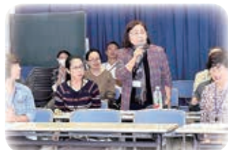
△第1回目の練習は自己紹介からスタート。みなさん緊張しています。