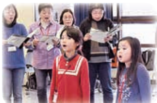
△小学生の参加者も堂々と歌っていました。