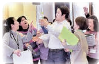
△演技をしながら歌うことにも慣れ、表現の幅が広がっていきます。