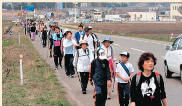
△信濃川河岸段丘ウオークの様子です。みなさん、小千谷の自然の中をさっそうと歩いていました。