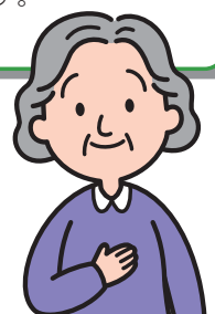
COPDと診断されたAさん（60代女性）

その後、禁煙外来で禁煙に挑戦。ニコチンパッチを使いながら禁煙を開始しました。今ではきっぱりたばこをやめることができ、酸素吸入はせずに生活できています。治療を続けながら、階段も以前より楽に上れるようになりました。早く受診してよかったと思います。