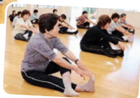
絶えぬ笑い、楽しいので、常に笑顔で困らない