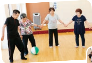
手をつないでボールをパス！