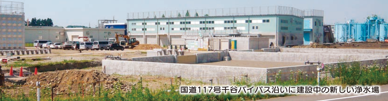
国道117号千谷バイパス沿いに建設中の新しい浄水場