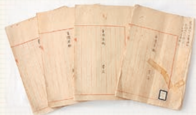
△市指定文化財「岩村高俊(精一郎) 自伝草稿」