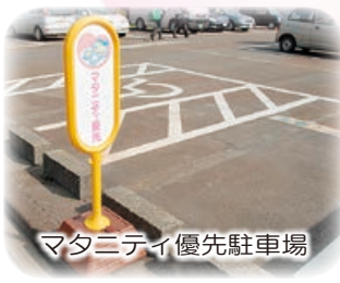
マタニティ優先駐車場