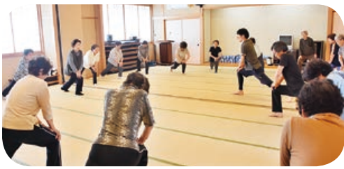
頭と体を使ったゲームを行いました

○参加者の声 ▽1人ではなかなか運動できませんが、教室があるとみんなで楽しく運動できます。 ▽参加すると体がほぐれる気がして、2・3日は調子が良いです。 ▽体操は疲れますが、仲間としゃべりながら参加できるのでストレス解消になります。