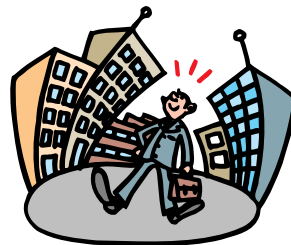
A Business man