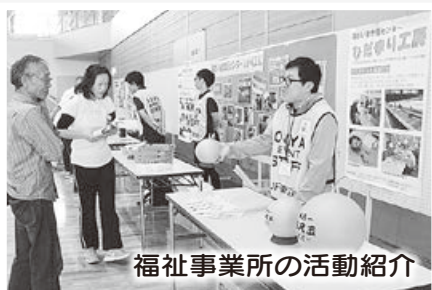
福祉事業所の活動紹介