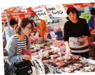
小千谷うまいもの祭