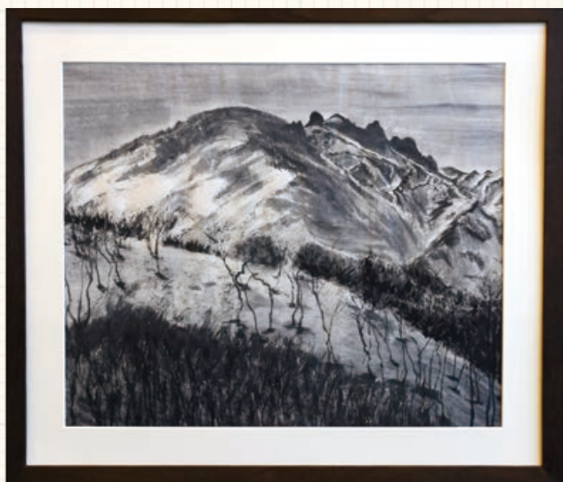
△水墨画の部／『春を待つ八海山』

下書きは半日、仕上げは一晚で描きあげました。絵を描くこと自体はあまり苦勞しませんでしたが、この絵を描くため、八海山に登るのに苦勞しました。4月の末頃で、表面がアイスバーン状態の時に رفتたため、滑りやすく、とても歩きにくかったことが印象に残っています。