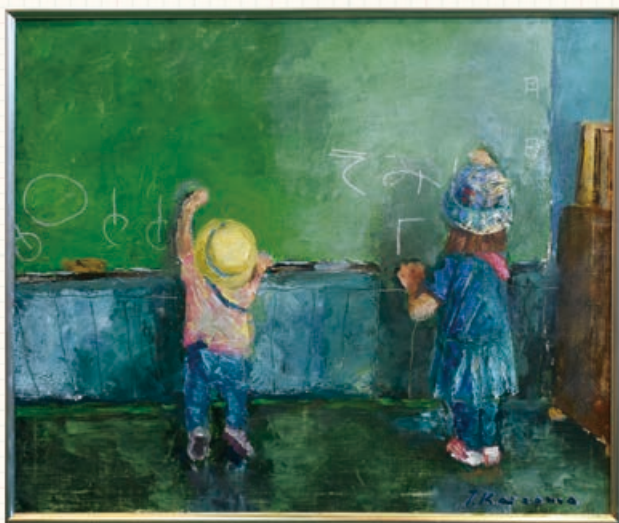
△洋画・版画の部／『放課後の美術館』

小千谷市展・小千谷市総合文化展が11月1日(木)～4日(日)に東小千谷体育センターで開催されました。審査の結果、次のみなさんが入賞されました。市長賞作品と作者のコメントをご紹介します。