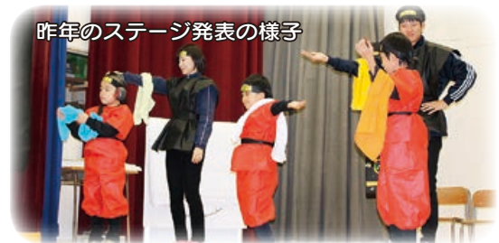
昨年のステージ発表の様子