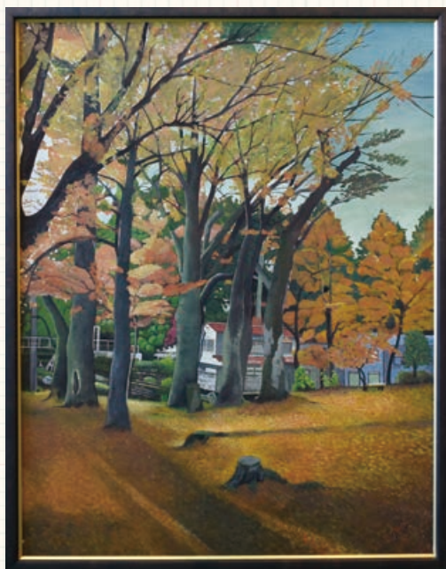
▷日本画の部／『夕暮れの船岡公園』