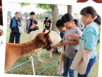
山本山まつり&クラインガルテン収穫祭

おぢや〜る、総合体育館、おぢやクラインガルテンふれあいの里の3会場で、「おぢやれフェスタ2018」、「小千谷うまいもの祭」、「山本山まつり&クラインガルテン収穫祭」が開催されました。どの会場もおおぜいの方でにぎわいました。