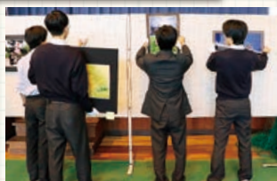
△会場の設営には、高校生など、おおいの方々が携わっていました。