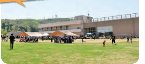
市民の家・小千谷信濃川水力発電館 おぢや～る Ojiya-ru

市民の憩いの場として、また電気のふるさと信濃川を学習できる施設として2016年オープン。遊び・キャンプ・合宿など多様な利用が可能で、学習・交流の拠点として活躍中です。