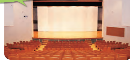
市民会館 Civic Center

478人収容の大ホールや各種会議室、和室を備えた施設です。大規模な文化イベントや発表会などの催しをはじめ、会議や教室など様々な用途で市民から利用されています。