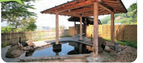
湯どころ ちぢみの里 Chijimi no sato

道の駅に併設された日帰り温泉施設で、ややぬるめのトロリとした泉質が特徴です。和風の「緋の湯」と洋風の「縮の湯」があり、男女週替わりで楽しめます。お食事処もあります。