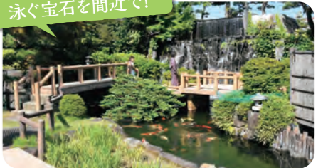
錦鯉の里 Nishikigoi no sato

錦鯉の泳ぐ姿をいつでも間近で鑑賞できる日本で唯一の錦鯉ミュージアム。日本庭園や屋内の鑑賞池で、約20種約300尾の錦鯉が美しい泳ぎを見せます。錦鯉の歴史に関する資料展示もあります。