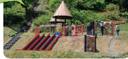
白山運動公園 Hakusan Sports Park

野球場、テニスコート、陸上競技場、多目的広場、サイクリングロード、児童遊園などを備える自然豊かな運動公園です。冬季にはクロスカントリースキーも楽しめます。