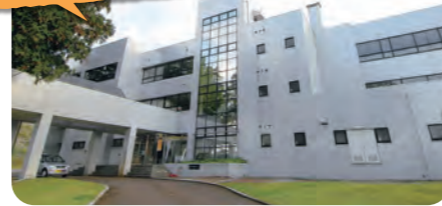
市民学習センター 楽集館 Gakusyukan

文化の振興、生涯学習を推進する施設です。100人収容のホール、展示室、6つの学習室、創作活動室を備えており、ミニコンサートやサークル等の作品展示など、幅広く利用できます。