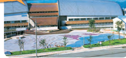
総合体育館 General Gymnasium

2つの多目的アリーナ、武道場、軽運動場、トレーニングルーム、幼児用のプレイルームなど多彩な設備を備えた総合スポーツ施設です。隣には市民プールもあります。