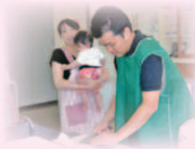
▲うぶごえ教室調理実習の様子～妊婦体験ジャケットを着用しています～