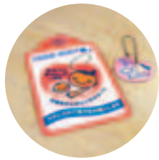
▲車用ステッカー（左）キーホルダー（右）

優先対象者の表示として、母子健康手帳をお渡しするときに「マタニティキーホルダー」と「車用ステッカー」、「エコバッグ」を配布しています。このキーホルダーやステッカーなどをお持ちの方を見かけたら、席や順番を譲るなど、さりげないやさしさの気持ちを保持して見守っていただけたらと思います。市内協力事業所でも、マ