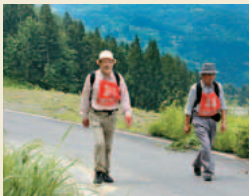
●適度な運動と「腹八分」を心がけようと思えます。(金倉山トリムウォーキング大会にて)