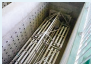
かくはんき攪拌機