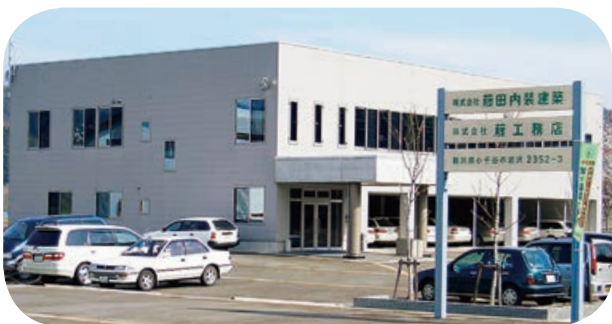
△公益のために私財を寄附 (株)藤田内装建築