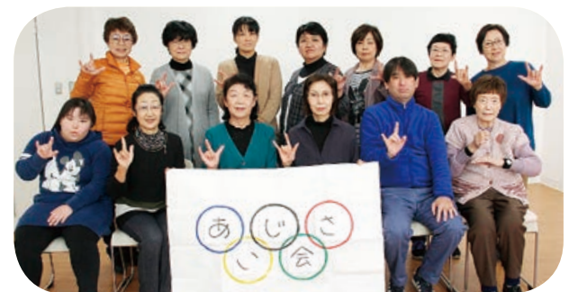
△県以上の表彰を受賞 手話サークルあじさい会