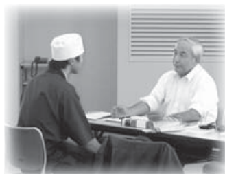
△前回開催時の様子

商工観光課商工振興係 ☎83-3512 ✉kanako@city.ojiya.niigata.jp