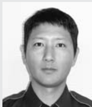
見附から来て、あまり知り合いませんでしたが、

入団後はドンドン友だちが増え、楽しく毎日を送っています。消防団は無理なく楽しんでできるボランティアですので、今後も続けて地域の役に立ちたいです。