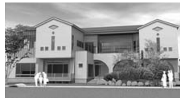
△おぢや保育園完成予定図