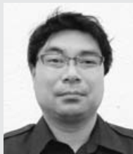
消防団に入団してボランティアを動かしたり、広報活動をして

入団後はドンドン友だちが増え、楽しく毎日を送っています。消防団は無理なく楽しんでできるボランティアですので、今後も続けて地域の役に立ちたいです。