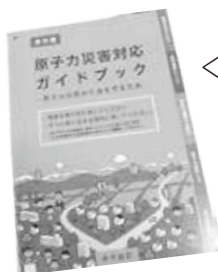
◁原子力災害対応ガイドブック

紛失した方はお問い合わせください。また、市ホームページからも閲覧や印刷ができます。