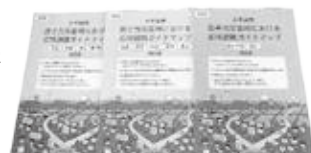
△原子力災害時における広域避難ガイドマップ