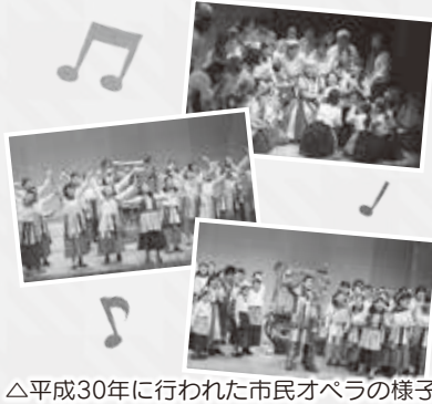
△平成30年に行われた市民オペラの様子

☎82・91111 82・91112 syougai-sk@city.ojiya.niigata.jp