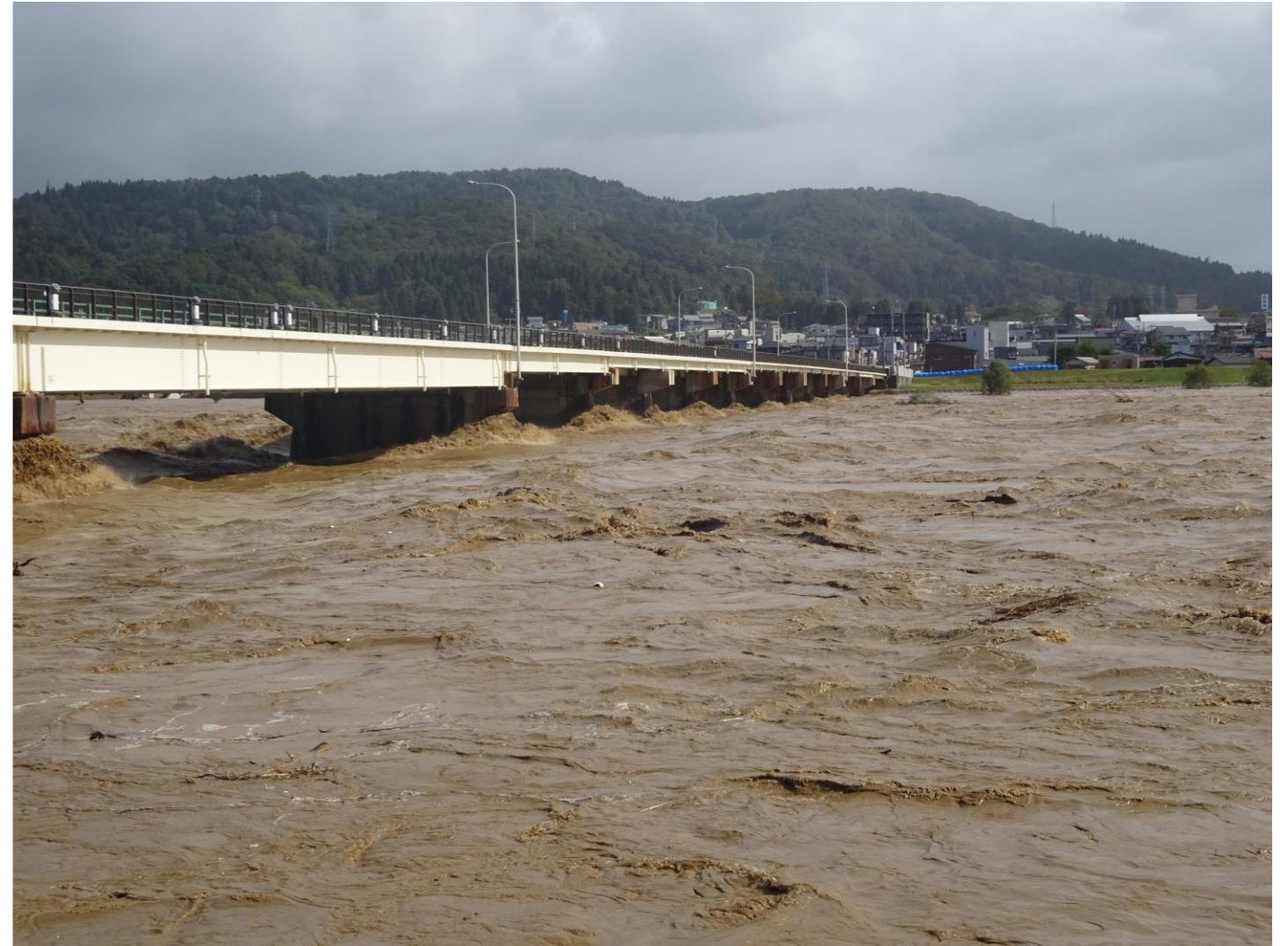
令和元年の台風19号で増水した信濃川 10月13日撮影