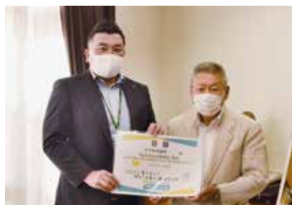
△明治安田生命保険（相）様

8月18日に、明治安田生命保険相互会社様から「私の地元応援募金」として、411,400円を寄附していただきました。8月20日に、東北電力ネットワーク株式会社長岡電力センター様から、LED街路灯25灯を寄贈していただきました。