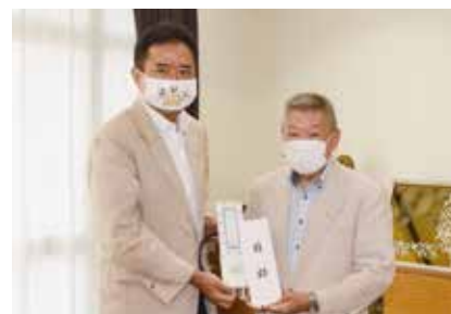
△東北電力ネットワーク(株)様