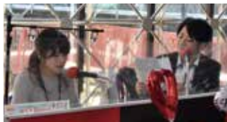
△ラジオ番組の様子

現在所属している会社は自宅でのリモートワークが主で、ダブルワークも推奨されているため、仕事と自分のやりたいことが両立できます。このような自由な