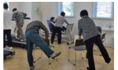
△介護予防事業「体しゅっきり教室」

低く、10年前に比べて認定率が改善した地区として全国で3番目になりました。一生懸命取り組んできた事業の成果が表れ、うれしく思います。