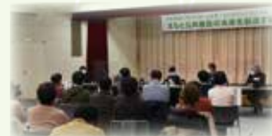
△12月6日に行われたシンポジウムの様子

■申込・問い合わせ／建設課都市整備室 ☎83-3514 ☎kensetu-tk@city.ojiya.niigata.jp