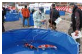
△新潟県錦鯉品評会

市長 私もいろいろなところに出かける機会が多いのですが、「小千谷って〇〇があるよね」と何か必ず言われます。最近では「ラーメンの激戦区だよ」なども。それだけ小千谷が認知されているのだと改めて思いますね。それと併せて、中越震災で全国のみなさんから助けていただいたこともあって、よその人に対して優しいといえますか、ずっと人を受け入れられる気質や雰囲気がある人たちが多いのではないかと思いますね。