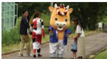
△「小千谷こい唄」撮影の様子

小千谷の魅力は、祭りなどに対する情熱でしょうか。祭りだけではなく、地域の伝統芸能などにも熱心に取り組んでいるので、もっと多くの人に見てもらいたいと思います。市民の方でも知っているけれど見たことがない、という方が多いと思うので、見ていただく機会を増やしたり、SNSで発信したりしていきたいですね。また、出演しているのでも少し恥ずかしいですが、「小千谷こい唄」も幅広い年代の方から見ただき小千谷のPRにつながると思います。