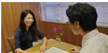
△「めぐりあいサポートセンター」でのお仕事の様子

今年、南アフリカで開催される世界大会に出場するので、小千谷を世界に発信していきたいと思っています。