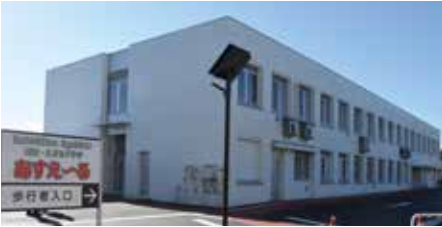
△健康・こどもプラザ「あすえくる」

介護予防事業や健康づくり事業などを実施しています。おかげさまで、令和2年9月末の介護認定率は、県内20市の中で一番