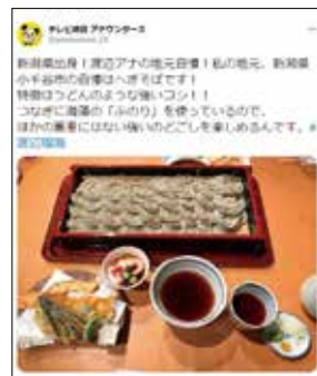
△テレビ朝日アナウンサーズ (@announcers_EX) Twitter公式アカウントより

入社してすぐに始めたインスタグラムに、小千谷にお住まいの方や、小千谷市出身という方から応援メッセージをいただくことがあります。ほかにも、私の家族や友人を通して、「いつも番組見ているよ」と伝えてくださる方もいて、仕事で疲れている時にそういったメッセージを見たり聞いたりすると、あたたかい気持ちになります。この場を借りてお礼申し上げます。昨年は、新型コロナウイルスの影響で思い描いていた一年とは全く違ったという方も多かったことと存じますが、まだまだ決して油断できない状況ではありますが、新しい年が小千谷の皆様にとって素晴らしい年となりますよう心から祈っております。