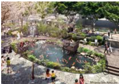
△親水空間内錦鯉の池イメージ