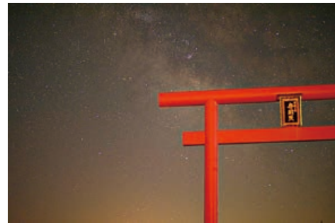
▷投稿者：twitter_ogoさん ▷撮影場所：吉谷

「#おぢフォト」を付けてInstagramに投稿された画像の中から1枚を紹介します。