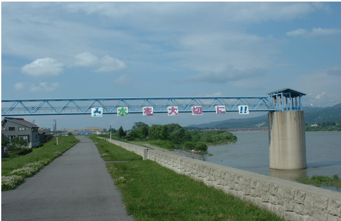
小千谷浄水場水管橋