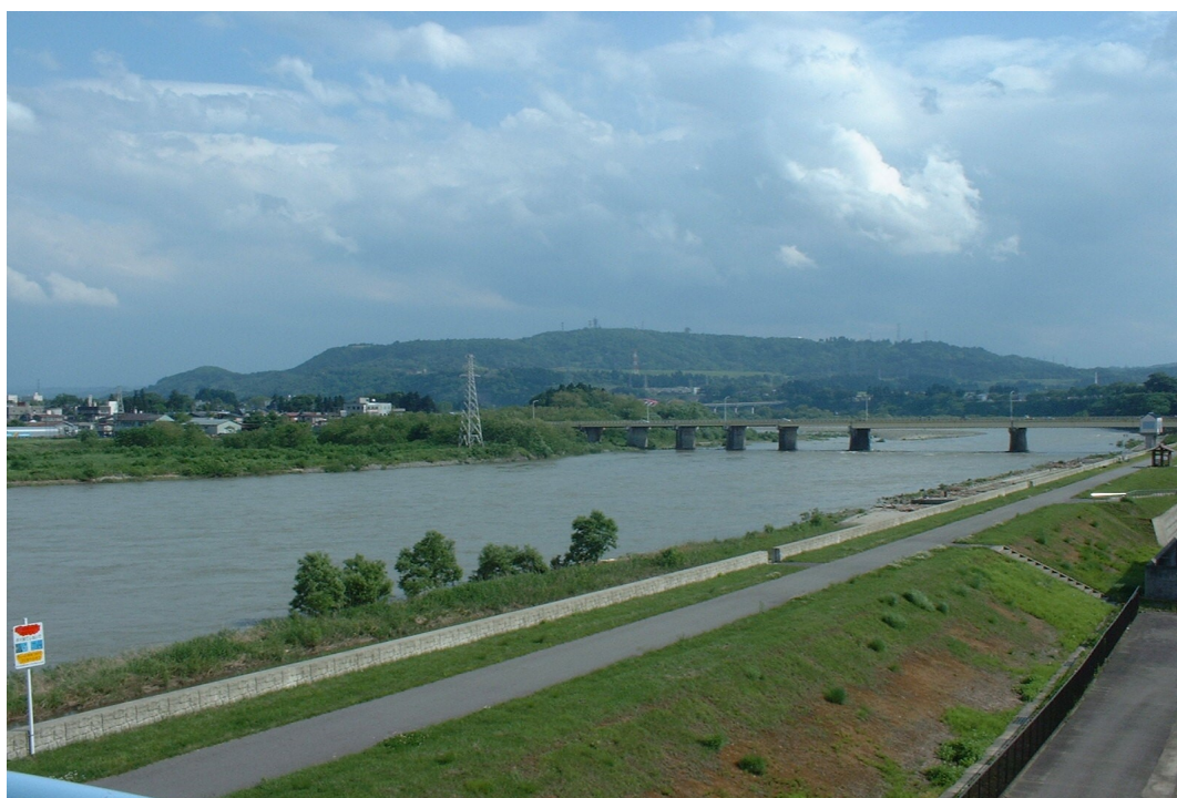
小千谷浄水場水管橋より信濃川、山本山を望む

小千谷市は、水道水の水質検査の適正化や透明性の確保のため、法令に基づき地域性を踏まえた水質検査を実施しておりますが、このたび、令和2年度の水質検査計画を策定しましたので公表いたします。