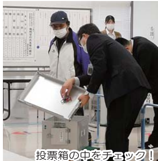
投票箱の中をチェック！

公正な選挙のために、最初に投票する有権者は、「投票箱の中に何も入っていないこと」を確認することができます。早起きして一番乗りした人だけが体験できる特権です。期日前投票の場合には、初日に一番乗りする必要があります。みなさんもチャレンジしてみてください。