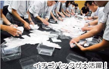
イチコパックが大活躍！

ほかに投票用紙の100票束を正確に数える用紙計数機や用紙の表裏・天地を揃えなくても候補者別に分類できる自動読取分類機も活躍しています。