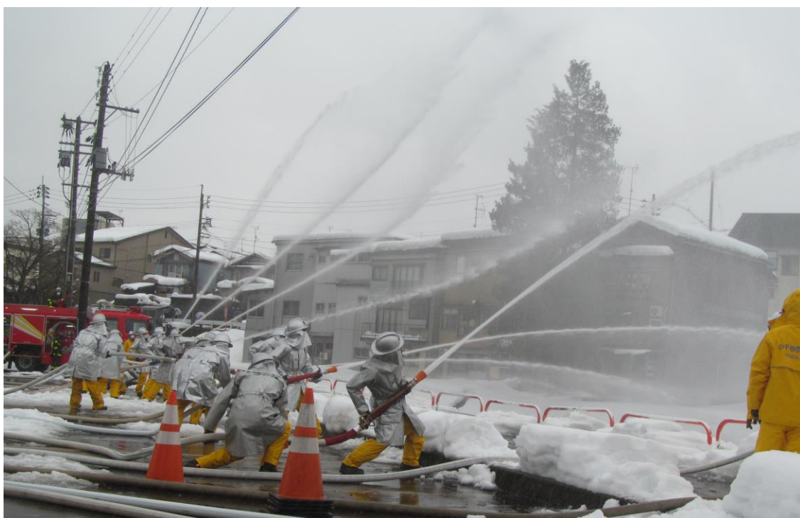
出初式一斉放水（サンプラザ駐車場に於いて）