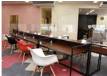
△コワーキングスペース