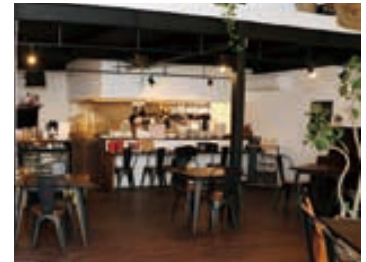
▽令和3年9月開業：NISCIRO（四之町）