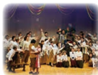
△小千谷コミュニティーオペラ 2018「愛の妙薬」の様子

オペラは、音楽、演劇、文学、美術などさまざまな芸術分野が融合し構成されるため、「総合舞台芸術」と言われています。ぜひ、オペラをそれぞれの聞き方・見方でお楽しみください。