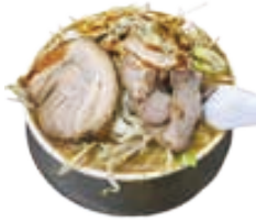
△カル麺特別メニュー「カルメン」の1つ「カルメンギョウ」

令和2年から続いている新型コロナウイルス感染症で数々の祭り、イベントなどができなくなっている中、闘牛場でオペラ公演という企画を聞いて小千谷の伝統と音楽の融合に新しい挑戦を感じ、応援しようと思いました。近年、毎年行っているTシヤツの販売で闘牛オペラの宣伝をしながら、麺を使ったイベント「カル麺」を参加店と一緒に盛り上げていけたらと思います、考案させていただきました。若者も先輩たちもみんな取り組める新しい町おこし。イベントとして文化になればいいと思います。ピンチはチャンスです。ともにもがみましょう！