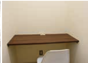
△個人リモート会議スペース