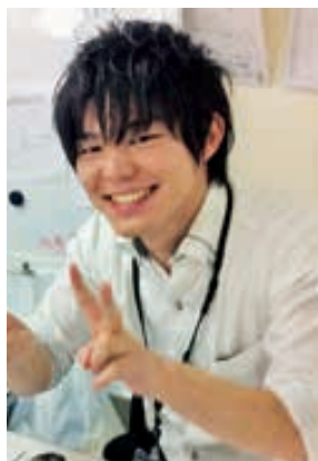
児童合唱団員の保護者として公演を陰でサポート

オペラへの参加は、子どもへの教育と経験を積ませるのが目的です。外国語で歌を歌い、舞台で演じる経験。地域の優しい方々と協力しながら舞台の完成を目指す経験。プロの方々の姿・行動を間近で接し体験できる経験。示したことは一部であり、得られる経験は、まだまだ無数にあります。これがどれだけすばらしく価値のあることか想像に難くないと思います。子どもの何事にも代えられない経験のために、裏方としてこれからも協力していきたいです。