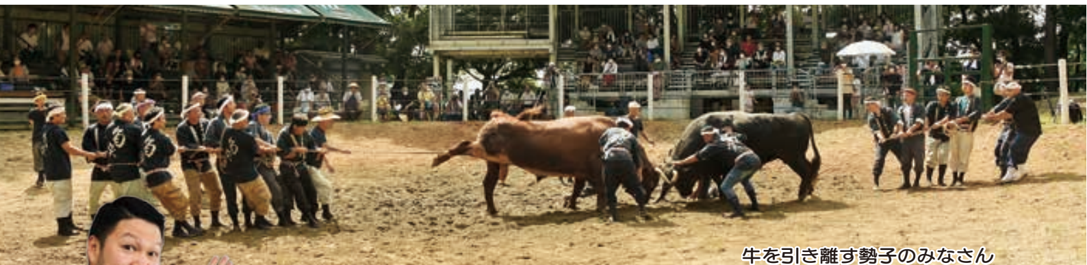
牛を引き離す勢子のみなさん