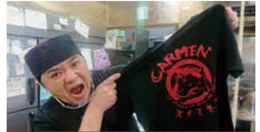
カル麺プロジェクト