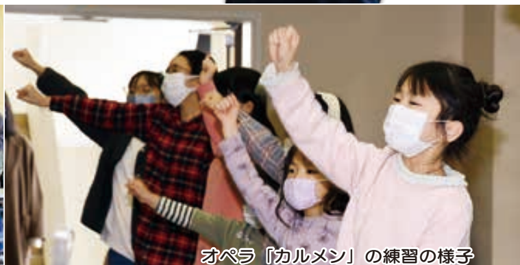
オペラ「カルメン」の練習の様子