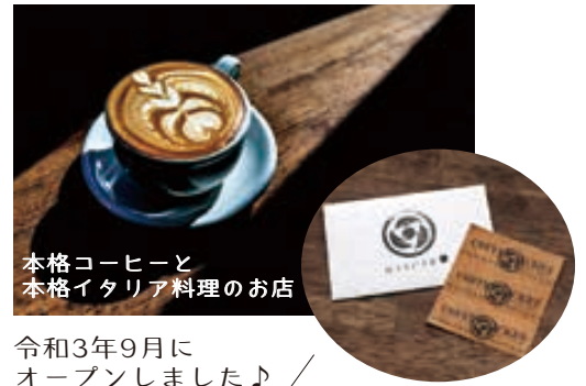
本格コーヒーと本格イタリア料理のお店