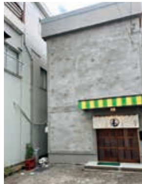
△令和3年8月事業拡大：おぢや酒場 もぶ煮（本町2）