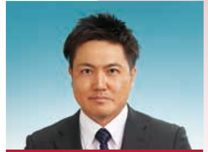
小千谷コミュニティーオペラ実行委員長

日本初、闘牛場で行われる市民オペラ「カルメン」は、小千谷を広くアピールできる可能性を持つ事業だと思っています。小千谷の文化を広くアピールできることをとても嬉しく思います。 市民オペラ「カルメン」の開催日は、毎年5月の第2土曜日に開催している小千谷青年会議所の目玉事業「第36回わんぱく相撲小千谷場所」と同日でした。しかし、その事業性からぜひ参加したいと思い、わんぱく相撲小千谷場所を5月7日とする異例の措置を講じ、小千谷青年会議所としてバックアップをさせていただくことになりました。この異例の調整を行ったことから我々がこの公演に対し、並々ならぬ思いや決意があることをお分かりいただけるのではないのでしょうか。 私自身、実行委員長を務めさせていただいていますが、実務において無力です。演者、市役所の方、市民オペラ参加者、その他ご協力いただいているみなさんのおかげで開催に向かって進んでいます。みなさん本当にありがとうございます。そんなすばらしい小千谷が作り出す小千谷版カルメンをみなさんに見ていただき、感動していただきたいと思っています。