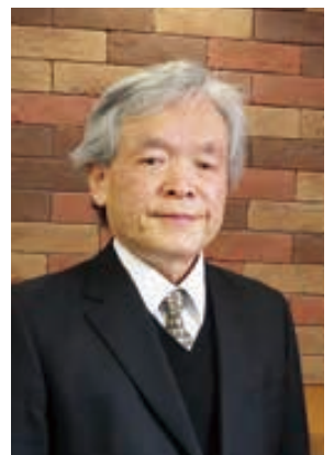
公演の舞台照明を担当