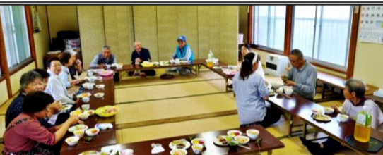
真人北部の市ノ沢花壇の花植え後のお楽しみ