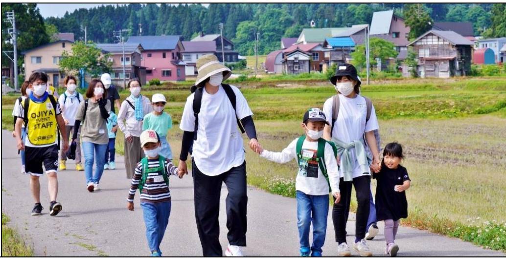
真人ふれあい交流館ホールでカラーコピーの写真を閲覧しています

当日は暑くもないウォーキング日和の早苗に染まった田んぼの中や新緑の深まった山中を、当日参加を含めた50人が気持ちよく歩いていました。 運動不足の参加者は、最初の準備体操のストレッチからきつい思いもしながらも源藤山集落の坂道も無事にクリアし、心地よいひと時を過ごしていました。