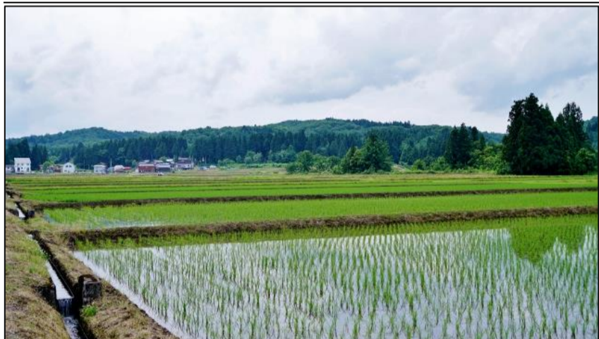
農地の集約と作業効率の向上が期待される栗山地区の圃場整備実施計画地区

ついて、現在の農地管理者に意向を調査しています。 図1では回答者(一部複数回答)の管理している農地についての意向が示されています。約半数の方が耕作を継続するとし、約1割の方が後継者に継承し、約1割の方が担い手に引き受けてもらうとして受け手が決まっていらないと回答されました。 担い手へ引き受けてもらいたい方が受け手が決まっていらないと回答した方が2割となっており、農地中間管理機構への貸付希望も6%ありました。一部の複数回答は「受け手がいない」と「農地中間管理機構」の両方に回答がされていることから、約25%弱の方が近い将来の後継者が決まっていらないことになってます。 図2では、回答者の年代別の意向の状況を見てみました。 回答者の年代の主力は50代〜70代で全体の88%になります。一番多い年代が70代の39%で、60代と70代を合わせると70%となり、会