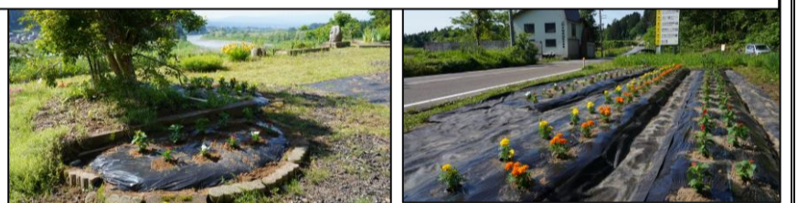
旧住民センター～旧真人保育園と上沢(右)・中山地内(左)