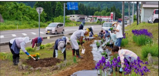
地域福祉センターみなみ前の花壇