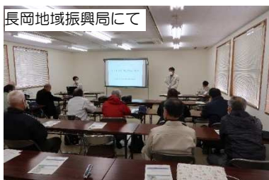
長岡地域振興局にて