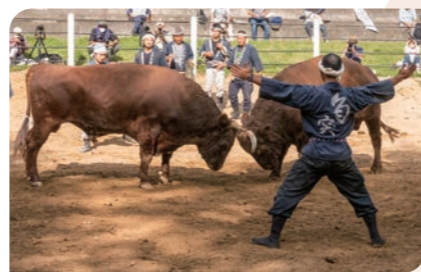
小千谷闘牛場 小千谷市小栗山2453

目の前で繰り広げられる巨体同士の取組、荒々しい息遣いは臨場感たっぷり! 毎年5月3日に初場所を迎え、11月の千秋楽まで毎月開催。会場内での実況・解説は分かりやすいので、初めて観戦する人も安心です。