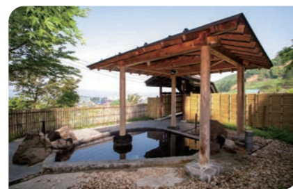
湯どころ ちぢみの里 (日帰り温泉施設) 小千谷市穉生甲1670-1

ややぬるめのトロリとした泉質が特徴。湯どころでは、和風の「紬の湯」と洋風の「縮の湯」を男女週替わりで楽しめます。食事どころでは、へぎそばや地元食材を使った料理が味わえます。