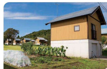
おぢやクラインガルテン ふれあいの里 小千谷市塩殿甲1814-2

農業未経験者でも野菜作りが楽しめる日帰り型、「ラウベ」と呼ばれる宿泊施設付き農園で田舎暮らしが満喫できる滞在型と、2種類を用意。大自然に抱かれた農園でお試し移住体験が楽しめます!