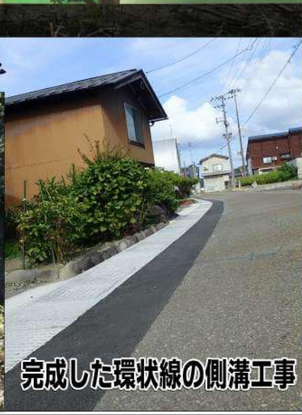
完成した環状線の側溝工事