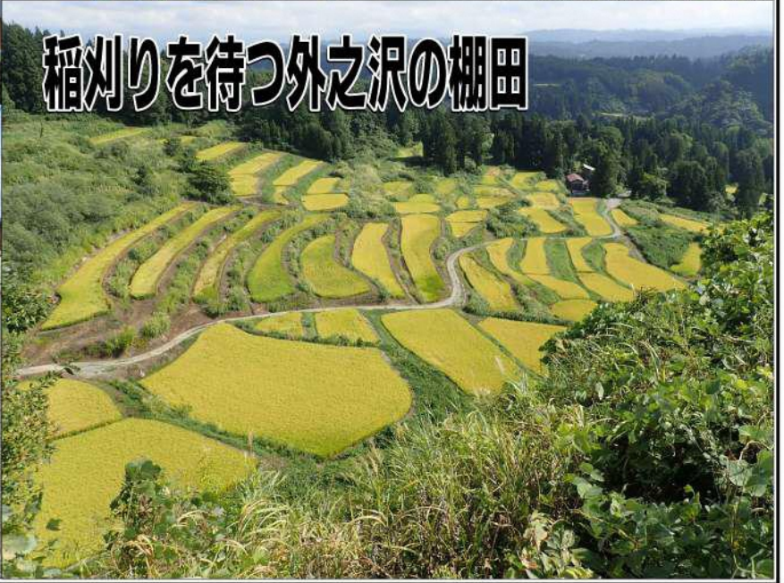
稲刈りを待つ外之沢の棚田