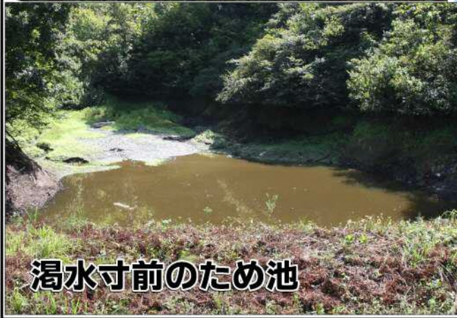
湧水寸前のため池