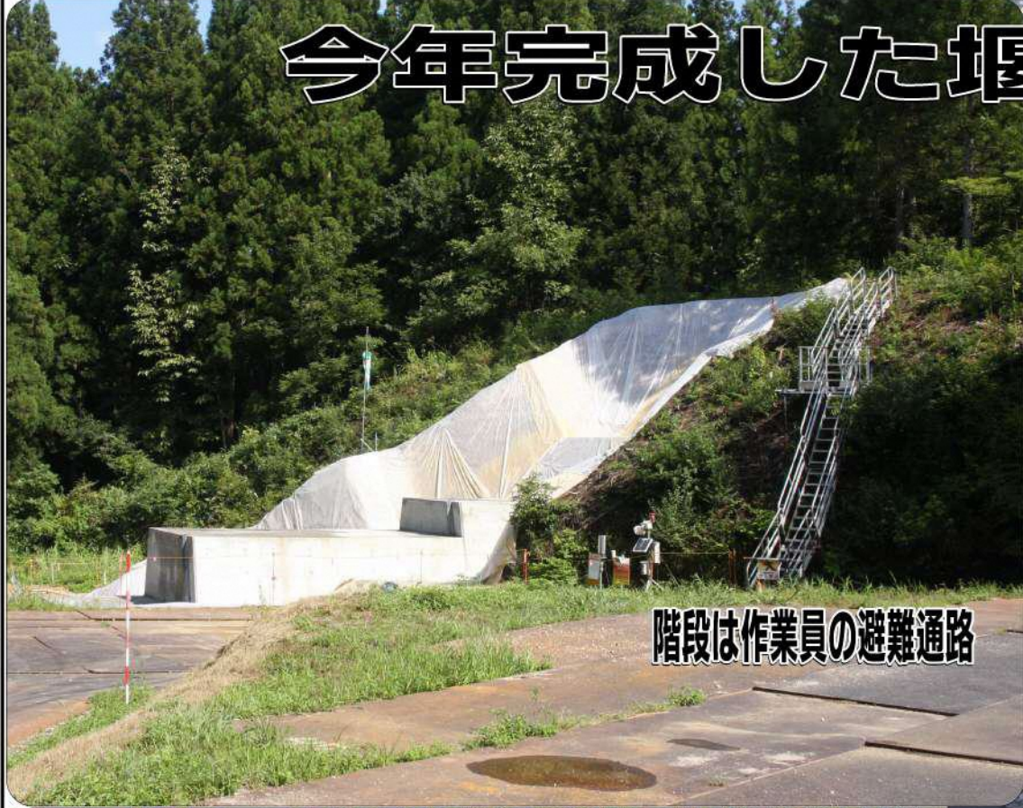
今年完成した堰堤