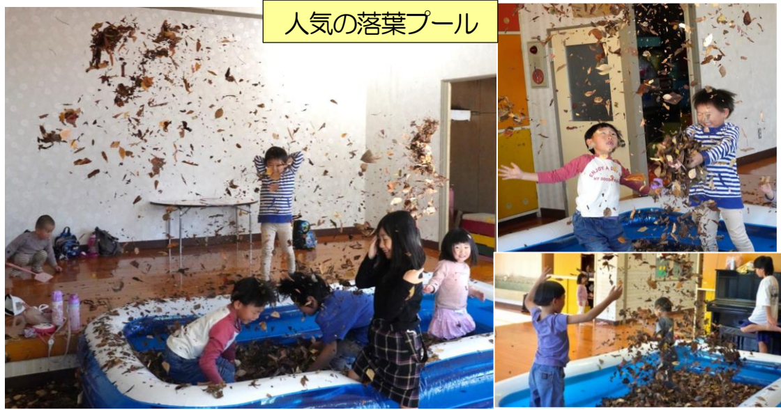
人気の落葉プール