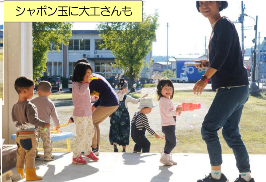
シャボン玉に大工さんも