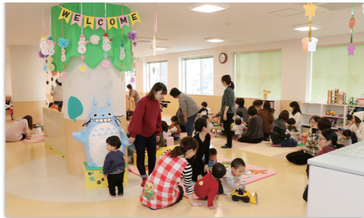
一時預かり わんパーク(子育て支援センター)には広いスペースや遊具があり、子どもと一緒に遊んだり、一時預かりをしてもらえます。