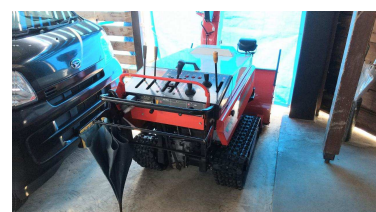
付属品 小型除雪機