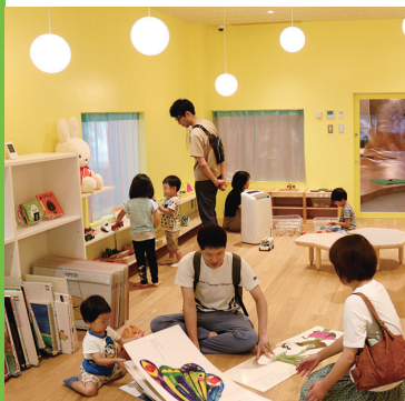
ホントカ。子アンカー

小千谷市は令和6年に市制施行70周年、中越大震災から20年の節目の年を迎えました。