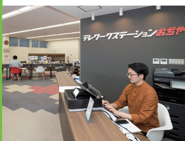
テレワークステーションおぢや