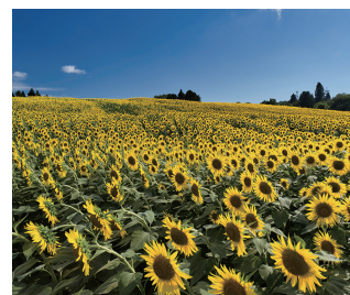
天空のひまわり畑