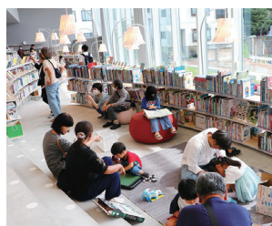
ホントカ。こどもとしょかん