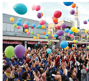
おぢやまつり万灯出発式

さらに輝く未来を目指して、市民みんなが主役になって取り組むまちづくりプロジェクトが「みんなの一歩で、未来づくり大作戦」です。小千谷市民でも、市外に住んでいる人でも、みなさんの一歩(ワンアクション)が、ワクワクするような未来のまちづくりにつながります!