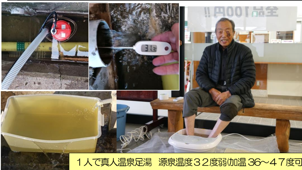
1人で真人温泉足湯 源泉温度32度弱(加温 36～47度可)

ったので補修し、安い汚水ポンプを設置してくみ上げました。放流水量とくみ上げる量のバランスをとるためにバルブを挟んで調整し、くみ上げる量を最小にして繰り返ししていましたが、エアが絡んでポンプが停止してしまいました。原因究明後にバルブの位置などや、停止時のバルブの閉止などで繰り返しして運転が出来るようになり、源泉かけ流し状態が可能となりました。降雪期を迎えたので本格的な実施は春以降に3、4人の足湯や源泉スタンドを進めたいと考えています。なお、一人用の足湯の器具を購入して交流館で展示してみました。来年のお披露目をお待ちください。今年一年間のご愛読ありがとうございました。皆様良い年をお迎えください。(渡邊)