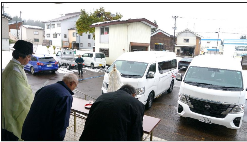
真人地区・岩沢地区合同のコミバス車両のお祝い

今回岩沢地区で入替えとなったコミバスと新たに配車された真人地区のコミバス二台を合同で、岩沢住民センターにてお祝いをさせていただきました。事故に合うことがなく無事に運行されることを祈念しました。