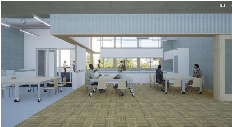
1F 研修室 (体育館側から見た図)