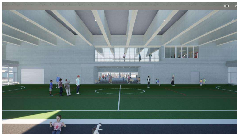
1F 運動場（南側から見た図）