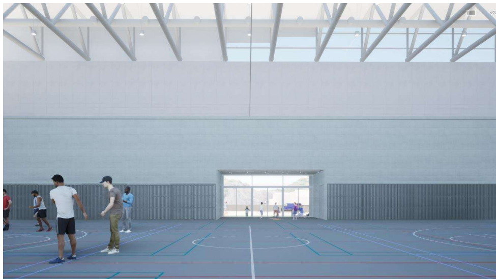
1F 体育館（東側からみた図）