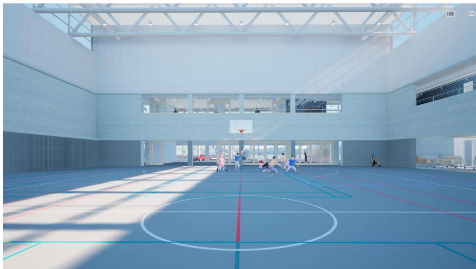
1F 体育館 (南側から見た図)