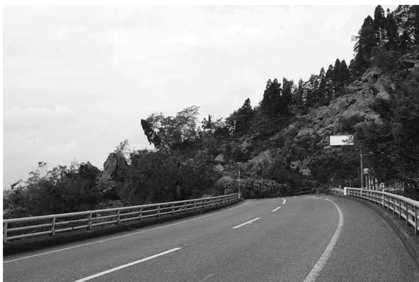
大規模に崩落し県道を塞いだ妙見（浦柄橋から）