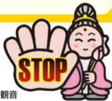
だまされちゃい観音