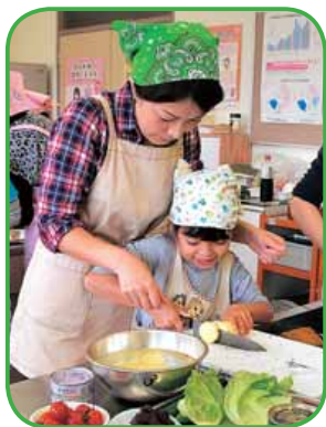
「おやこの食育体験教室」の様子