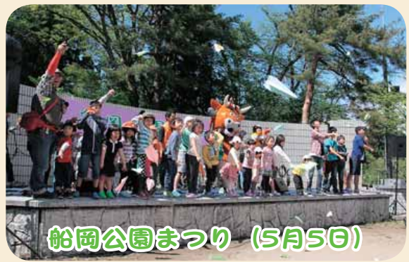
船岡公園まつり (5月5日)