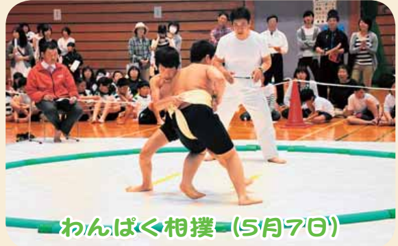
わんぱく相撲 (5月7日)