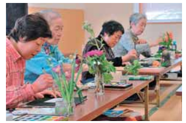
△季節の草花が並ぶ会場で、真剣な表情で制作します。

絵手紙に描きたい題材を各自で持ち寄って、約1時間半で数枚を仕上げます。制作終了後、他の参加者の作品を鑑賞し、先生から講評をいただきます。上