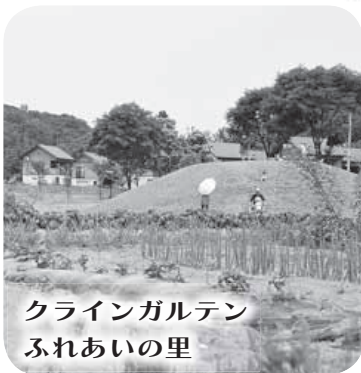
クラインガルテン ふれあいの里