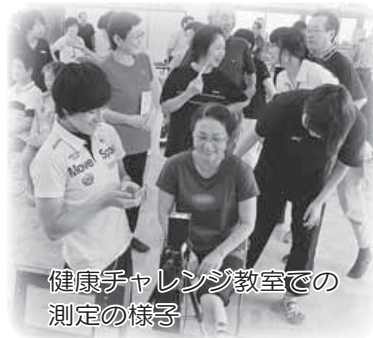
健康チャレンジ教室での 測定の様子