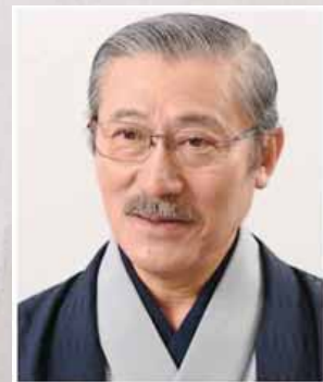
なかじま せい の すけ 講師/ 中島 誠之助

1938年東京生まれ。古伊万里など東洋古陶磁器を世に広める。数十年にわたる「骨董屋からくさ」の経験をもとに、古美術鑑定家として活躍する。テレビ「開運!なんでも鑑定団」(テレビ東京系)にレギュラー出演し、鋭い鑑定眼と歯切れのよい江戸っ子トークでお茶の間の人気者に。「いい仕事してますね」の名文句で、1996年ゆうもあ大賞を受賞。製品監修・解説・論評・エッセイ多数。現在もテレビ・CM・ラジオに出演するほか、講演で全国各地を回る。