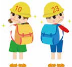
「そなえ館」イメージキャラクター そなえちゃんとしんぼうくん