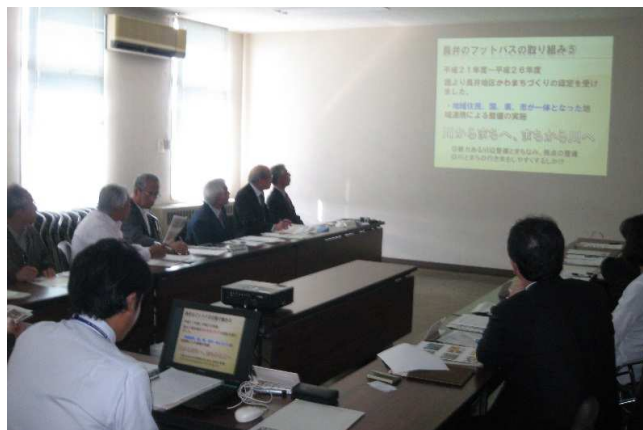
活動状況の説明を受ける参加者

今年は、10月6日と7日に山形県長井市で最上川の環境整備に取り組んでいる「長井市かわまちづくり推進協議会」の皆さんと意見交換などを行いました。