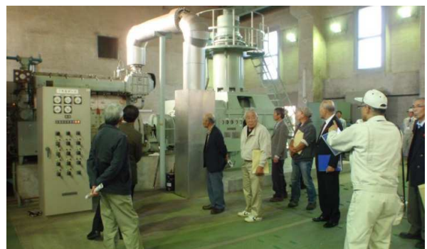
布施谷川排水機場を視察する参加者