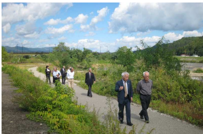
最上川沿いフットパスの状況

主な活動としては、最上川沿いに整備された「フットパス」を活用したイベントの開催に取り組んでいます。「フットパス」とは、森林や田園地帯、古い街並みなど地域に昔からあるありのままの風景を楽しみながら歩く【Foot】