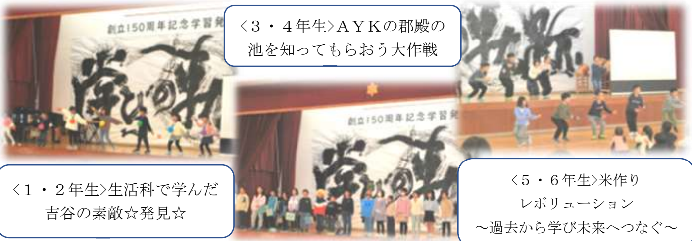
<3・4年生>AYKの郡殿の池を知ってもらおう大作戦

子どもたちがやりたいこと・伝えたいことを話し合い、自分たちで脚本・演出を考え、表現しました。各学級の創意と努力が光る内容に、ご来場の皆様からたくさんの応援メッセージをいただきました。ありがとうございました。