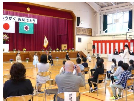
かわいい1年生が仲間入り

小千谷市の「おちやっ子教育プラン」の目指す子ども像『自ら考え 心豊かに たくましく生きる 小千谷の子ども』を踏まえ、当校教育目標「やさしく かしこく たくましく」の下、未来を切り拓いていける力を育て参ります。昨年度同様、ご支援をよろしくお願ひします。