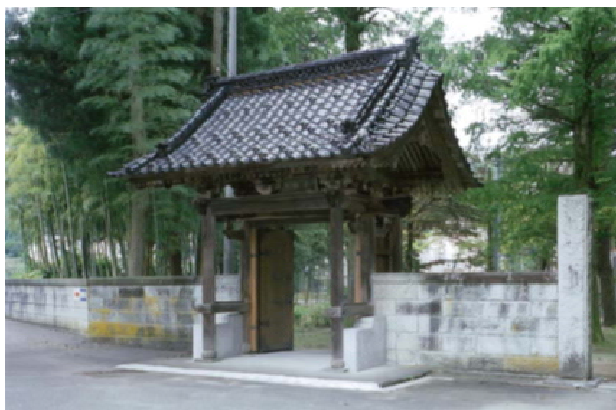
潮音寺山門正面側面外観 北東より

本件に関するお問い合わせ先／小千谷市教育委員会生涯学習課社会教育係（総合体育館内） 担当／山崎、林