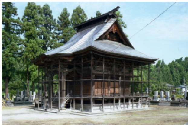
潮音寺観音堂外観 南より

◆その他／昨年 8 月に正式登録された「おっこの木主屋」につづき、市内の登録有形文化財は 7 件となります。