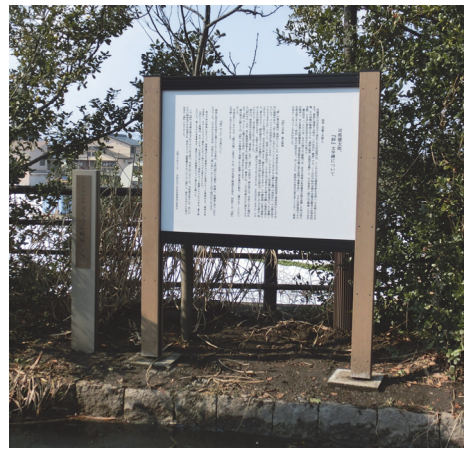
「峠」の文学碑説明看板